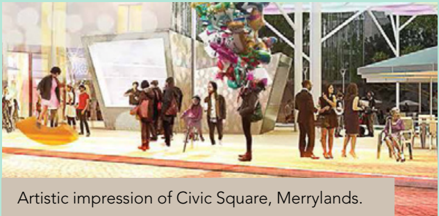
Artistic impression of Civic Square, Merrylands.

A vibrant new civic square in Merrylands is on its way courtesy of Cumberland City Council’s improved development application turnaround times. Demolition begins early next year to make way for the new space between McFarlane St and Merrylands Road.