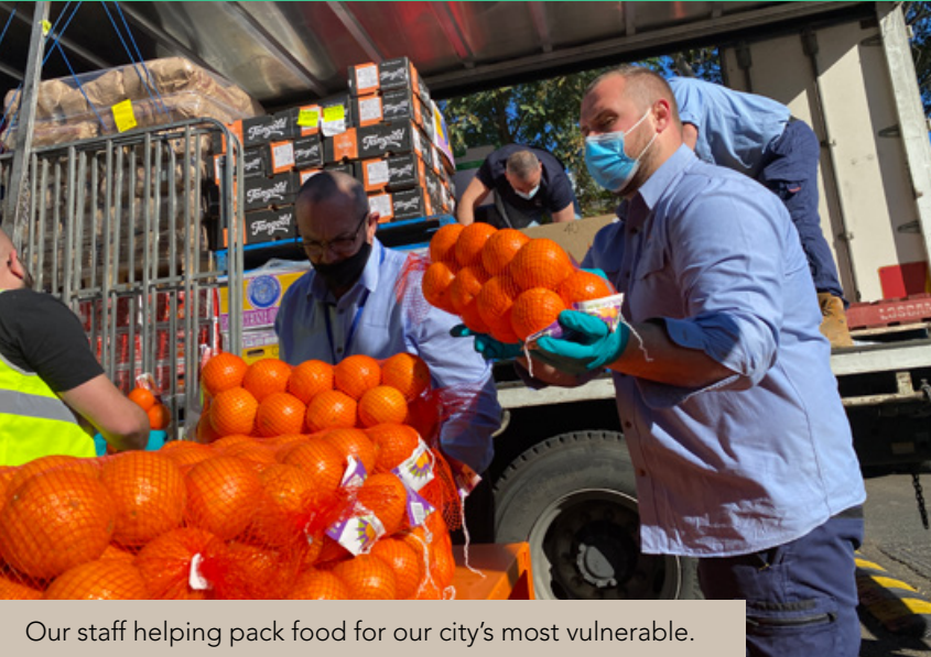
Our staff helping pack food for our city's most vulnerable.