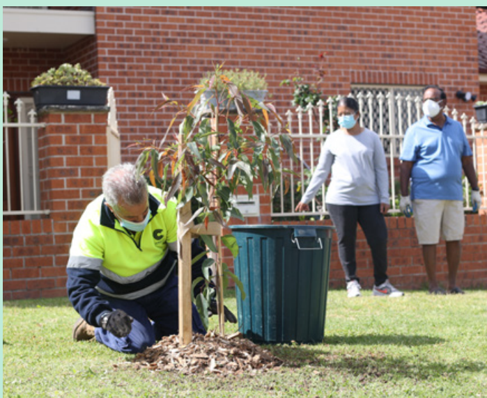
Staff planting adopted trees in their new homes, as part of this year's Adopt-a-Tree Program.