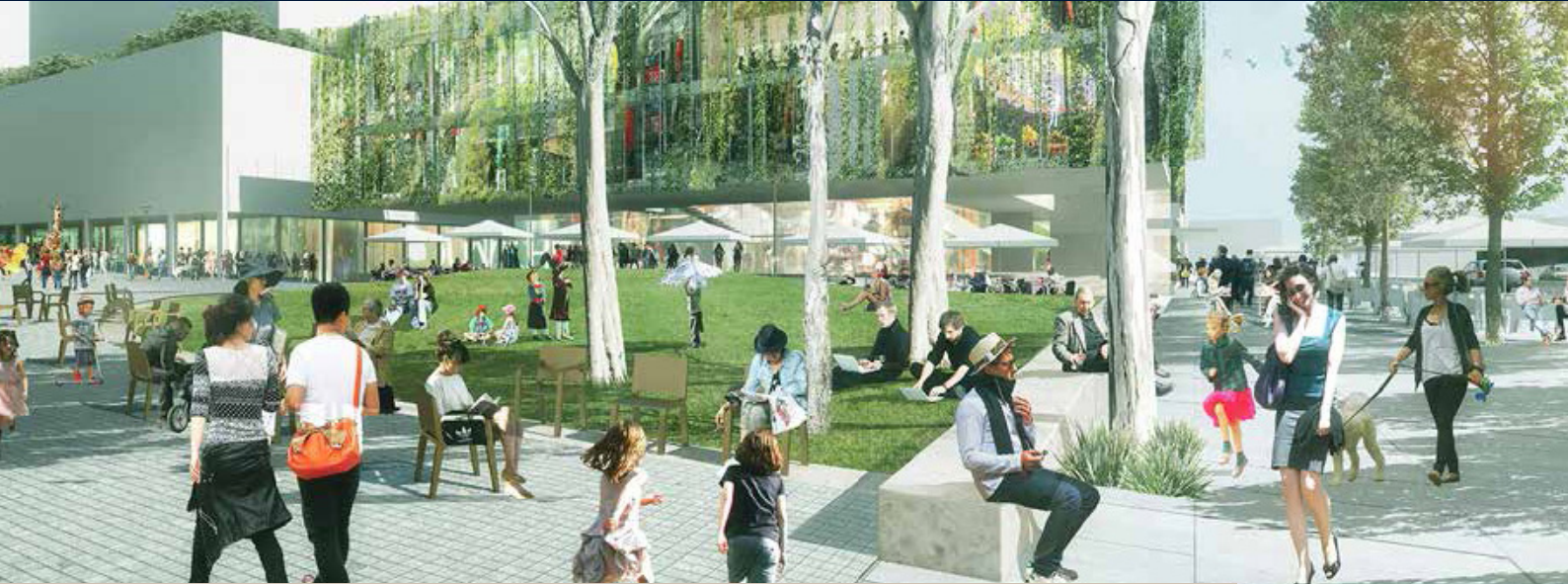
The $11 million civic square will receive $5.5 million state funding from the NSW Public Spaces Legacy Program.

The external refurbishment includes stormwater and drainage structural repairs to the building and painting. OzHarvest has used the Hall for food distribution during lockdown.