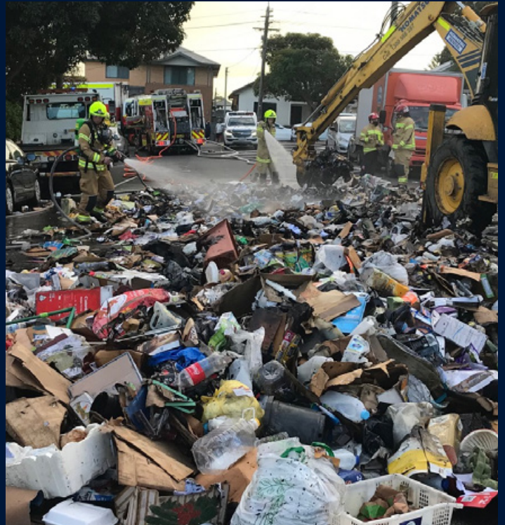
In August a garbage truck caught fire and was forced to dump its load in Auburn.

Book a collection or find out more on our website.