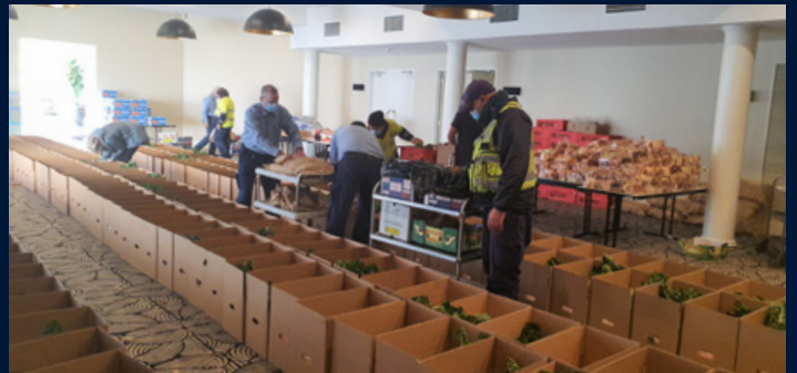
Food hampers being packed at the Holroyd Centre.