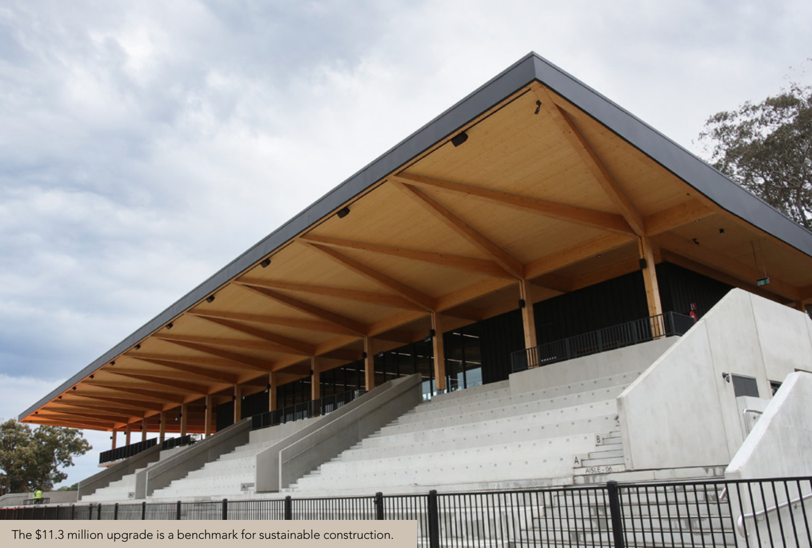
The $11.3 million upgrade is a benchmark for sustainable construction.